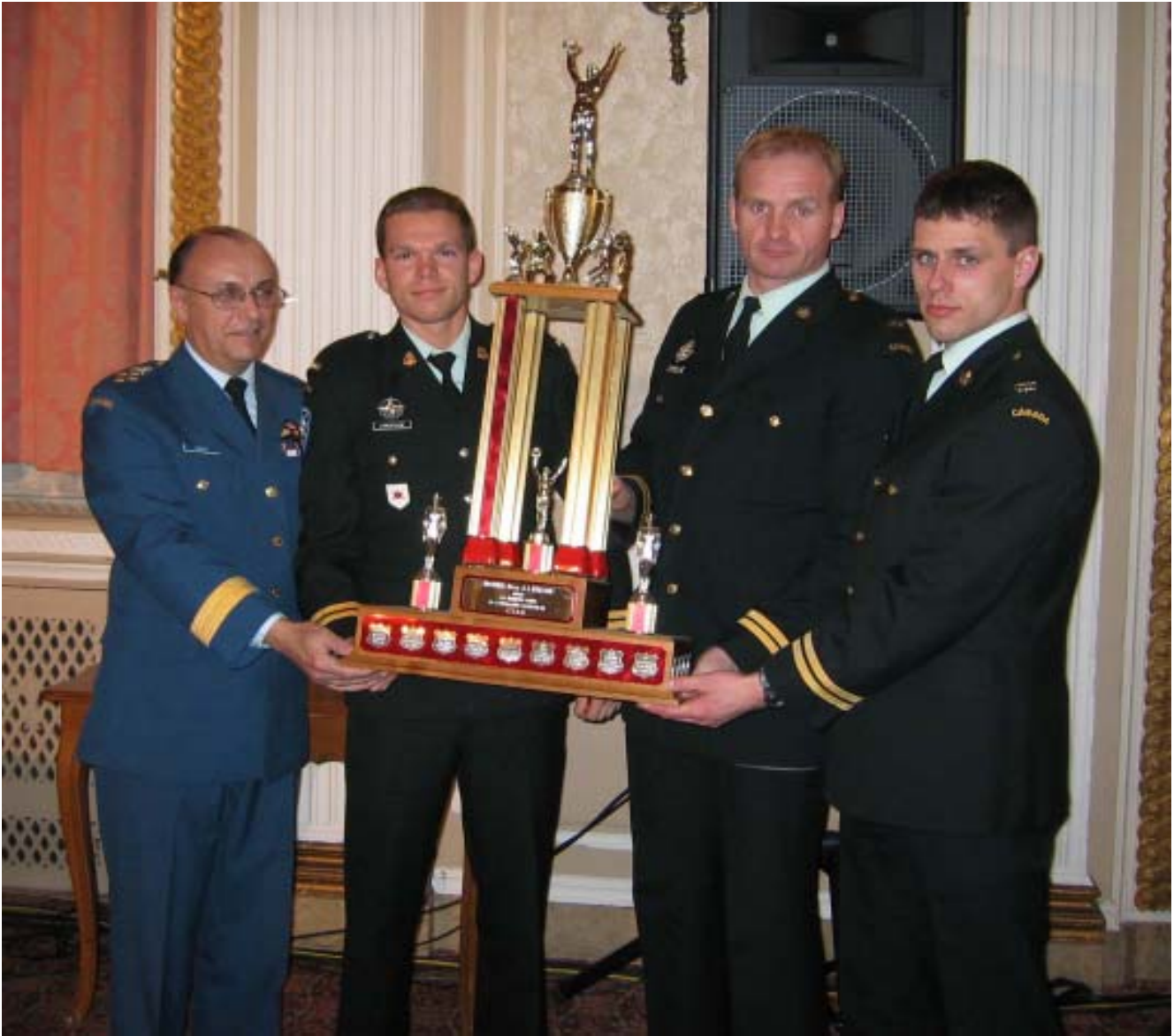
Presentation of the Paradis Trophy by Général Raymond Henault to members of the best team in the Canadian delegation at the CIOR Summer Competition